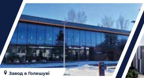
📍 Завод в Голешуві