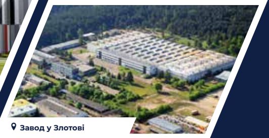
📍 Завод у Злотові