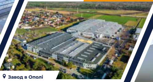
📍 Завод в Ополі