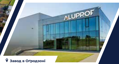
📍 Завод в Огородзоні