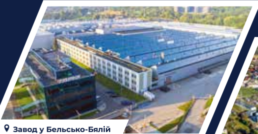
📍 Завод у Бельсько-Бялій