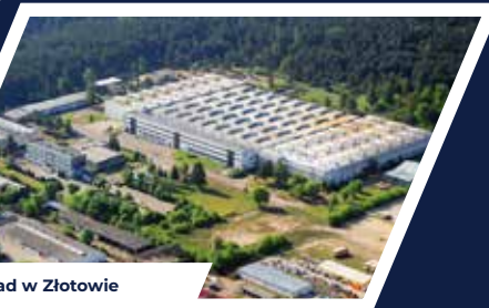
Zakład w Złotowie