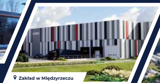
Zakład w Międzyrzeczu