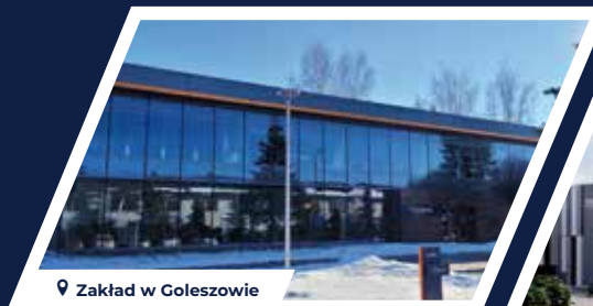
Zakład w Goleiszowie