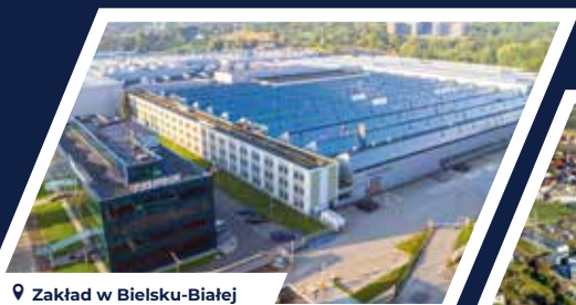
Zakład w Bielsku-Białej