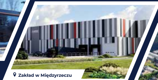
Zakład w Międzyrzeczu