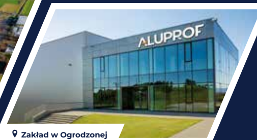
Zakład w Ogrodzonej