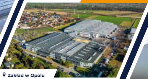
Zakład w Opolu