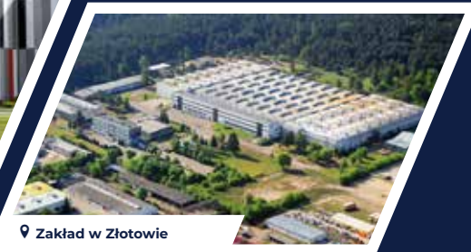
Zakład w Złotowie